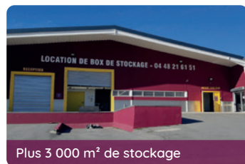
Plus 3 000 m 2 de stockage