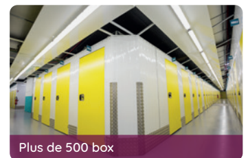
Plus de 500 box