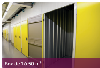
Box de 1 à 50 m 2